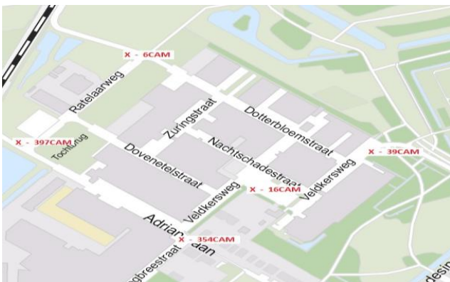
Cameralocaties Bedrijventerrein Schiebroek

De daadwerkelijke uitvoering van de camerabeveiliging komt steeds dichterbij. Inmiddels heeft Stedin de opdracht gekregen om de kabels te leggen bij de diverse cameramasten en is een en ander geregeld met elektriciteit en Ziggo. ProRec verwacht (afhankelijk van de benodigde vergunningen) dat voor de zomer alles zal werken en heeft bovendien nog een mooie aanbieding voor de ondernemers op het bedrijventerrein om ook hun eigen gebouw te kunnen beveiligen. Binnenkort hoort u hier meer van tijdens een speciale kwartaalborrel in het kader van de camera's